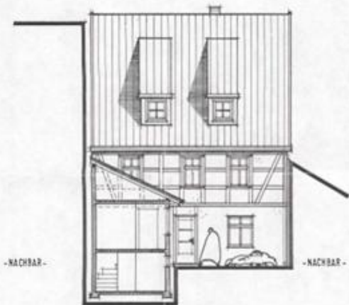
ANSICHT VON NORDEN (SCHNITT C-D)