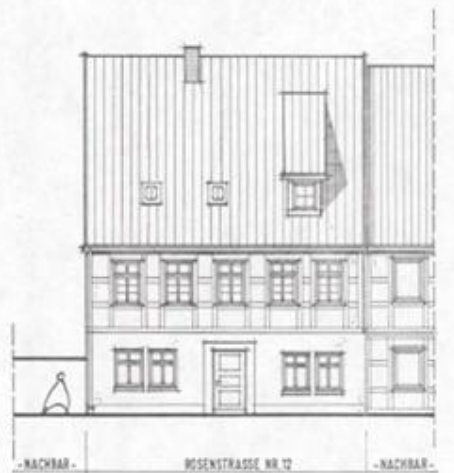
ANSICHT VON SÜDEN -ROSENSTRASSE-

Anfrage zum Baurecht 0349 91 1.8. Jan. 2012 Krip