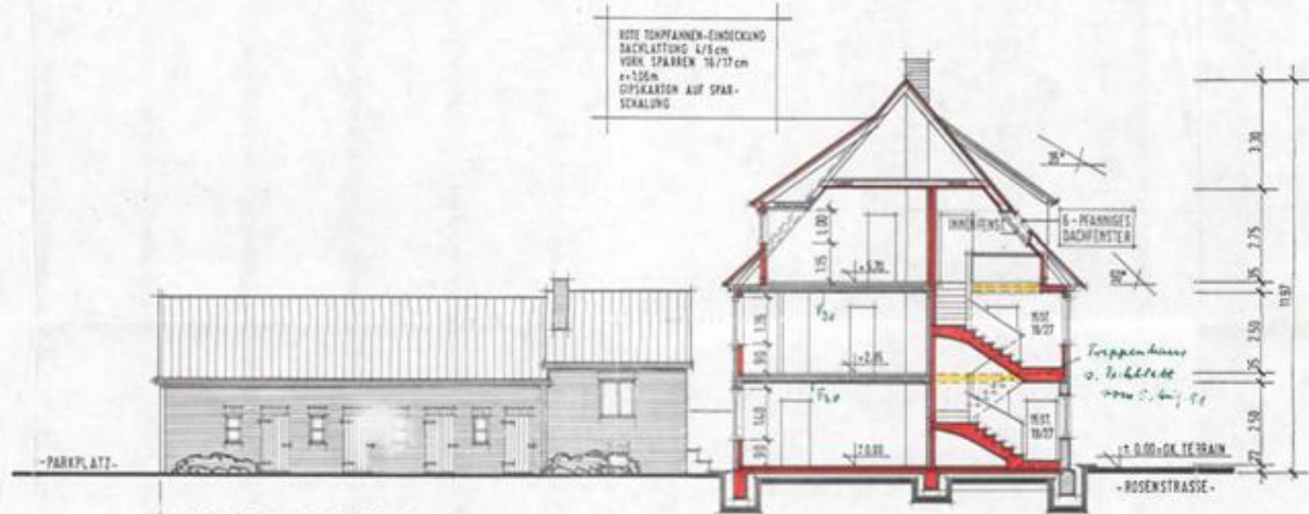
ANSICHT VON WESTEN -NEBENGEBAUDE-